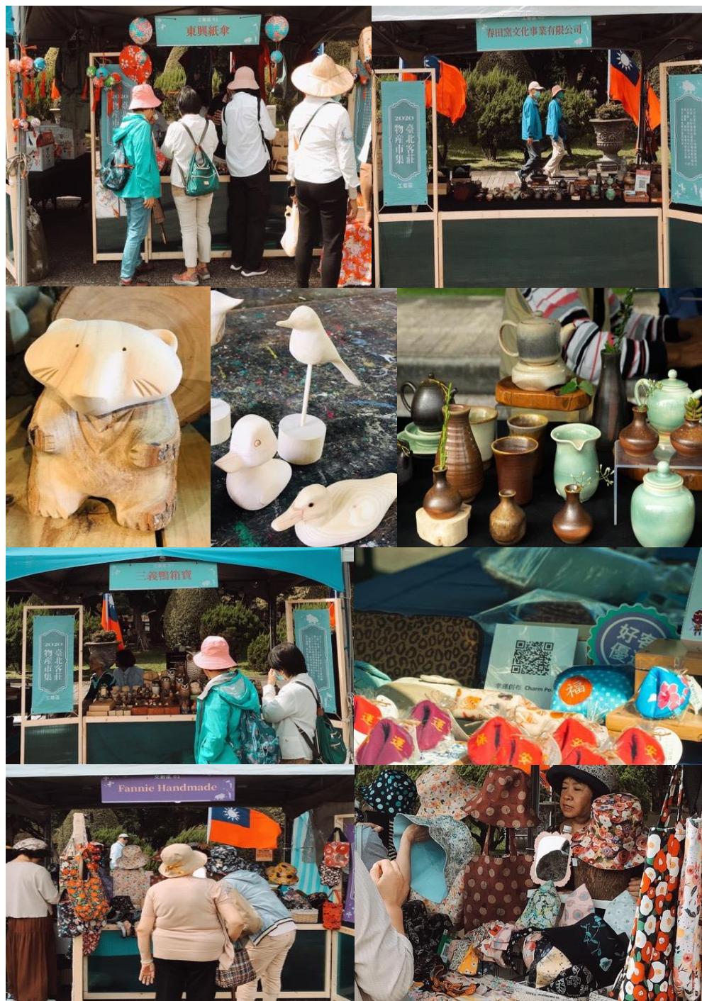
逛市集，欣賞來自客莊原鄉之手工藝品、文創品，來自美濃紙傘、三義木雕、燒窯、在地職人巧思文創手工帽及布包等。