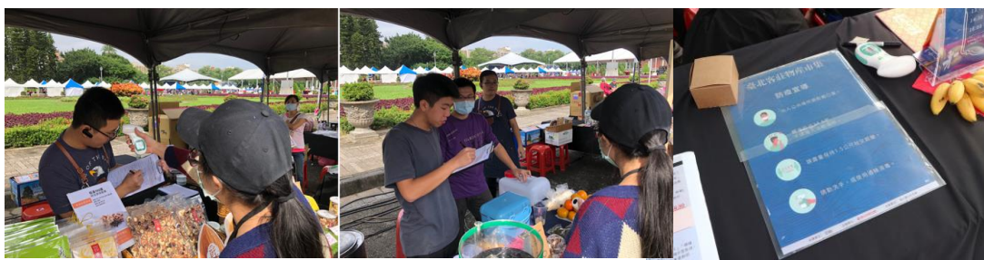
現場防疫宣導，攤商量測額溫及簽到實景照