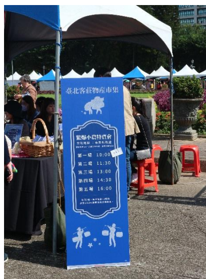
現場小農限量商品特賣活動，以優惠價格換購優質客莊農特產品，吸引民眾踴躍參加兌換，好評不斷！