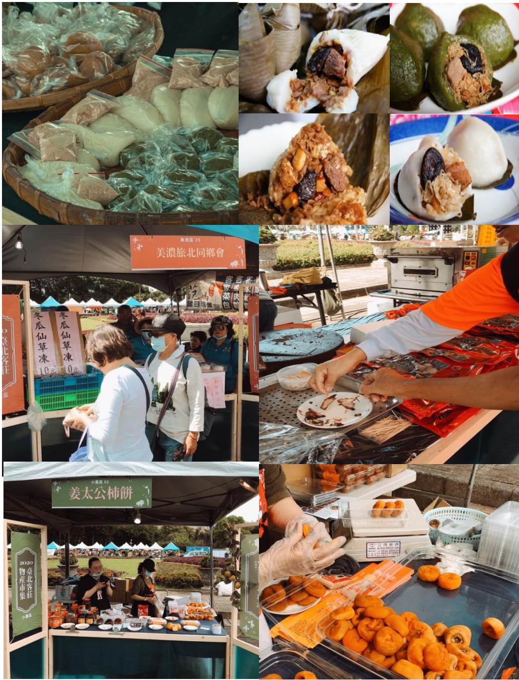
來自原鄉的農特產品及新鮮現做的客家米食，在臺北客莊物產市集就能品嚐到在地客莊好味緒。