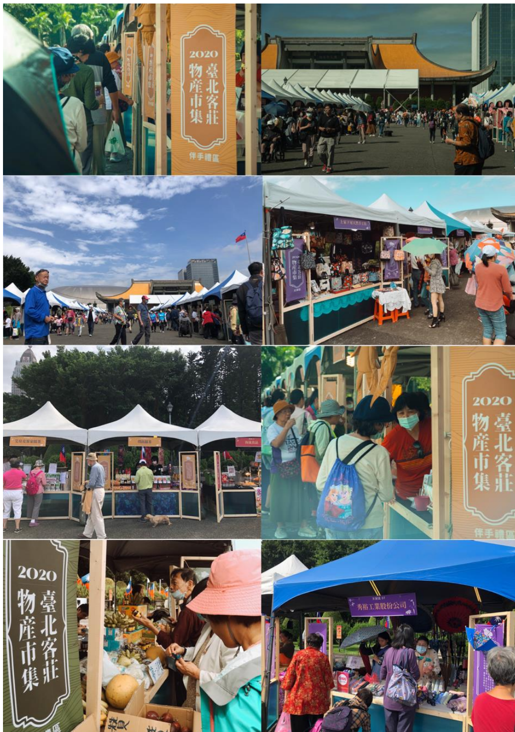
今年新穎創新的攤位設計，木作結構結合異材質招牌等，以木作質樸溫潤風格，呈現暖心的客莊風情意象。